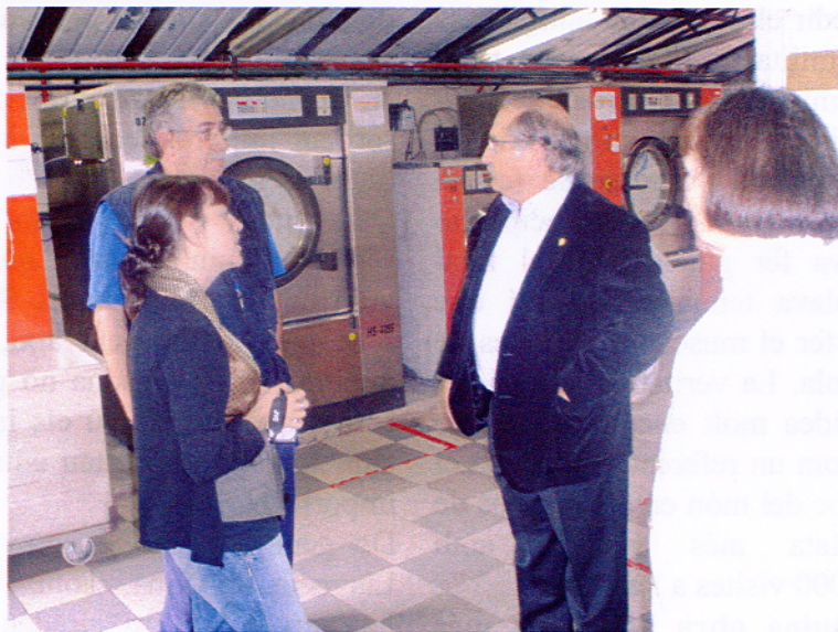
El Sr. Turull, visitant la bugaderia.