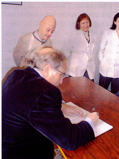
El Sr. Turull, signant el Llibre de Visites de Canigó.

Si he d'escollir una pastisseria em decantaria per la d'Àustria o la d'Alsàcia, aquesta és la que