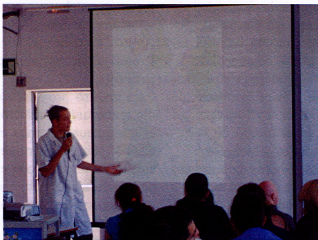
Harro presentant al Taller el seu projecte final.

El proyecto ha demostrado, una vez más, que Canigo hace gran hincapié al gran grupo, ya que nos pidieron que participaran todos en el proyecto y para terminar con un acontecimiento conjunto.