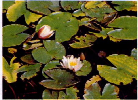
El taller de la Pilar a la Muntanya de Montjuïc. Nenúfars del parc.